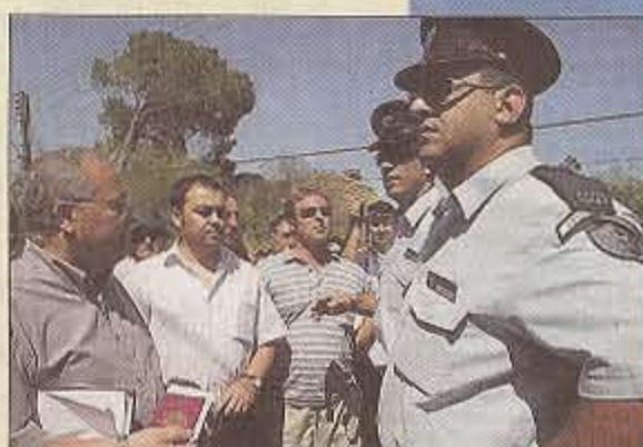
Turkse Cyprioten proberen de noord-zuidgrens over te steken bij Ledra Palace Checkpoint in Nicosia.

die Nicosia in tweeën knipte, het symbool van de verdeeldheid op het eiland. De Noord-Cypriotische president Talat, die door de Turken gekozen werd omdat hij streeft naar hereniging voor het einde van 2010, heeft sinds hardliner Papadopoulos aan Griekse zijde het veld moest ruimen een aanzienlijk toeschietelijker gesprekspartner gevonden. Zo was Christofias de eerste Cypriotische president die toe gaf dat het uiteenvallen van de republiek in 1963 ook te wijten is aan fouten aan Griekse zijde. Daarmee maakte hij de weg vrij naar nieuwe onderhandelingen, die letterlijk de weg vrij maakten in Ledra-street. De komende jaren zal er nog veel moeten gebeuren voor Cyprus weer echt herenigd zal zijn. Een van de neteligste kwesties vormen de oude eigendomsrechten: maken de uit het noorden gevluchte Grieken en uit het zuiden gevluchte Turken nog aanspraak op hun oude landgoederen, die vaak massaal bebouwd zijn?