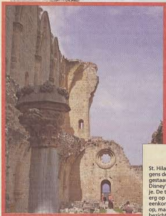
Bijzonder: de opgravingen bij Salamis...