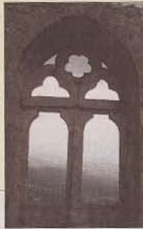
Door-kijkje vanuit St. Hilarion Castle...